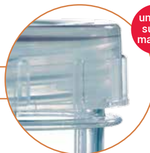
Cape avec joint : étanchéité parfaite