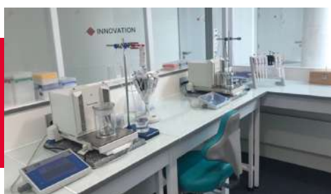
Laboratoire de Métrologie - Nemours

Une expertise multimarques couvrant toutes vos pipettes, monocanales ou multicanaux, pour un accompagnement centralisé et un seul partenaire de confiance.